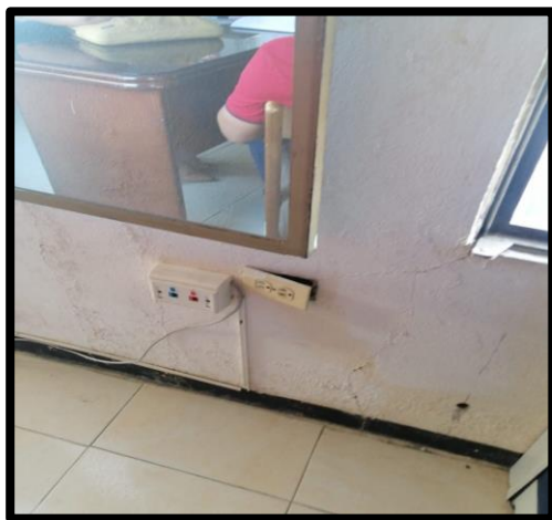
Figura -2 -3 -4 -5-6-7. Humedades en muros y viga canales, deterioro parte eléctrica.