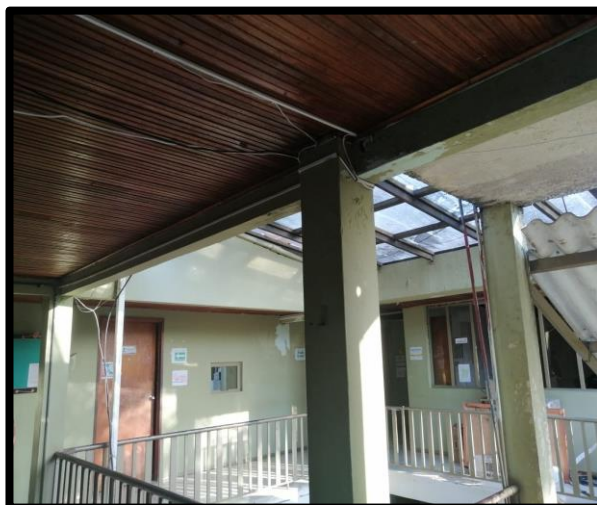
Figura -8-9-10. cielo Rasos deteriorados