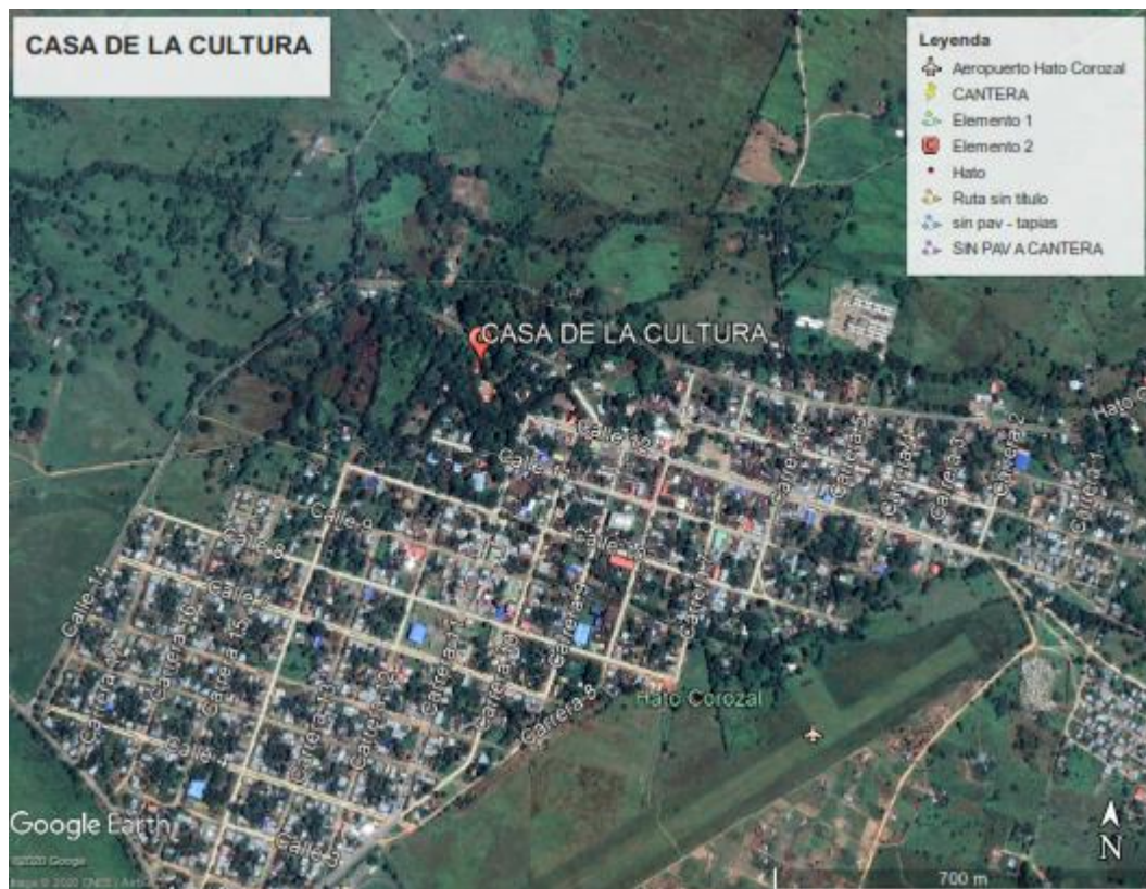
Figura 1.1. Localización del proyecto