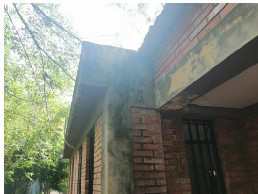
Figura 5- 6. Limpieza e impermeabilización de canales