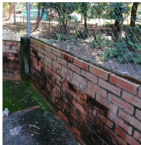
Figura 9-10 -11 -12. Limpieza muros y pisos