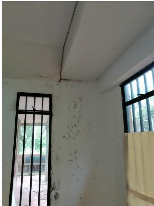
Figura -2 -3 -4. Desmonte e instalación de cielorraso