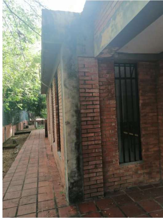
Figura 7-8. Pintura interior y graniplast exterior