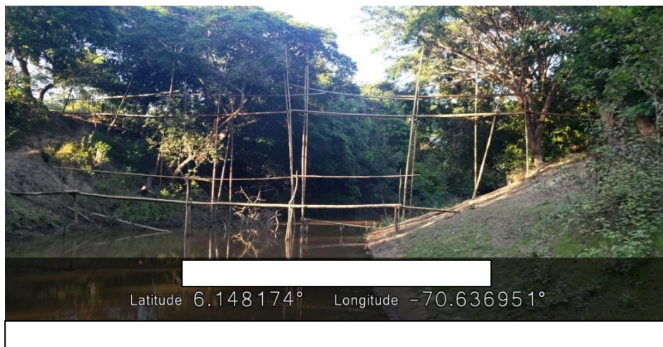
GEOREFERENCIACIÓN PUNTO DE EJECUCIÓN Y/O CONSTRUCCIÓN PUENTE HAMACA SOBRE EL CAÑO EL SAMUCO.