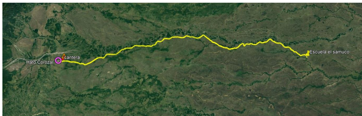
Figura 1.1. Tramo de vía para llegar al sitio de construcción de puente hamaca.

Puente que será construido, se encuentra ubicado sobre el caño el Samuco, específicamente en inmediaciones de la escuela El Triunfo.