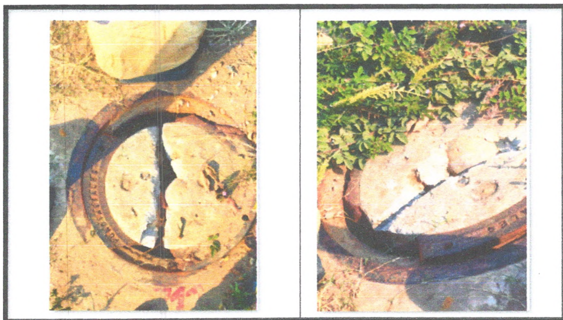
Imagen 2: registro fotográfico de daños