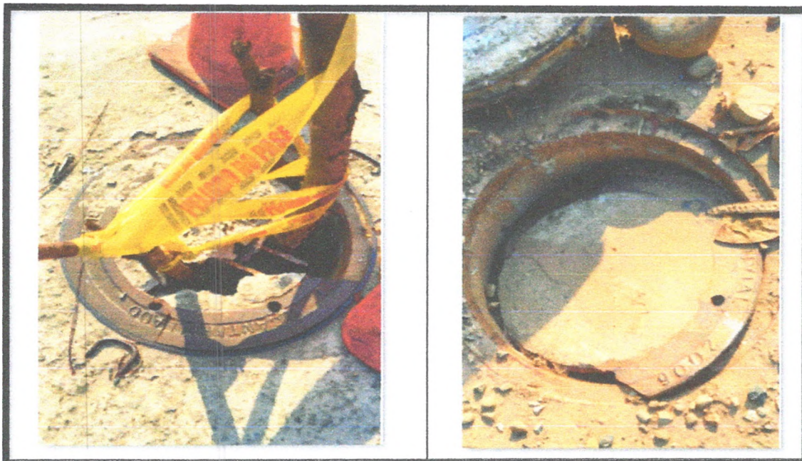
Imagen 1: registro fotográfico de daños