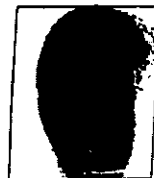
MUELLA INDICE DERECHO