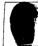
HUELLA ÍNDICE DERECHO