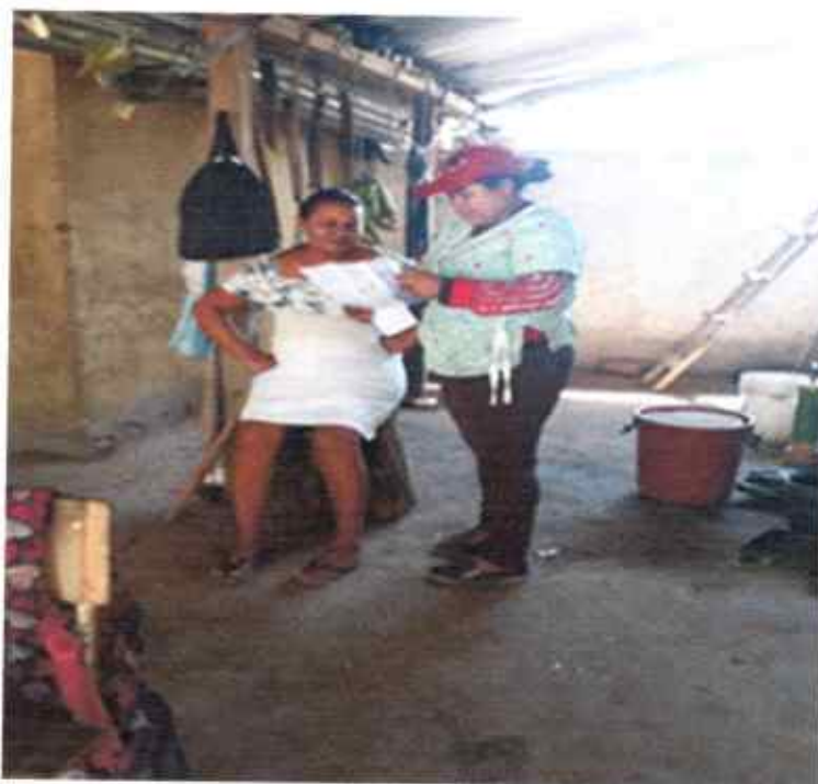
VEREDA LAS CRUCES