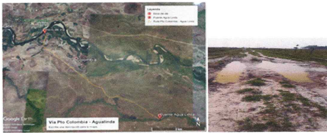
Imagen 1. Ubicación geográfica de la vía y estado actual