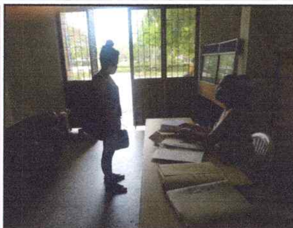
Registro fotográfico de ingreso a la plataforma de Discapacidad.